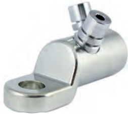
D50-240 x 16 SK-V-K

GPH® Mechanical Cable Lug 0.6/1 kV with sector channel and shear-off-head bolts