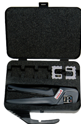
Kovček za orodje s prostorom za klešče in tudi od 5 do 6 čeljusti.

OEB0210 Čeljusti za orodje Elpress MOBILE za stiskanje zaključnih votlic 0,25-10 mm 2 . AWG 24-7.