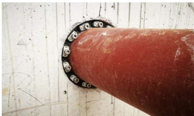
Vgrajeno tesnilo GKD 300 (izvrtina fi 200 mm in cevjo fi 160 mm).